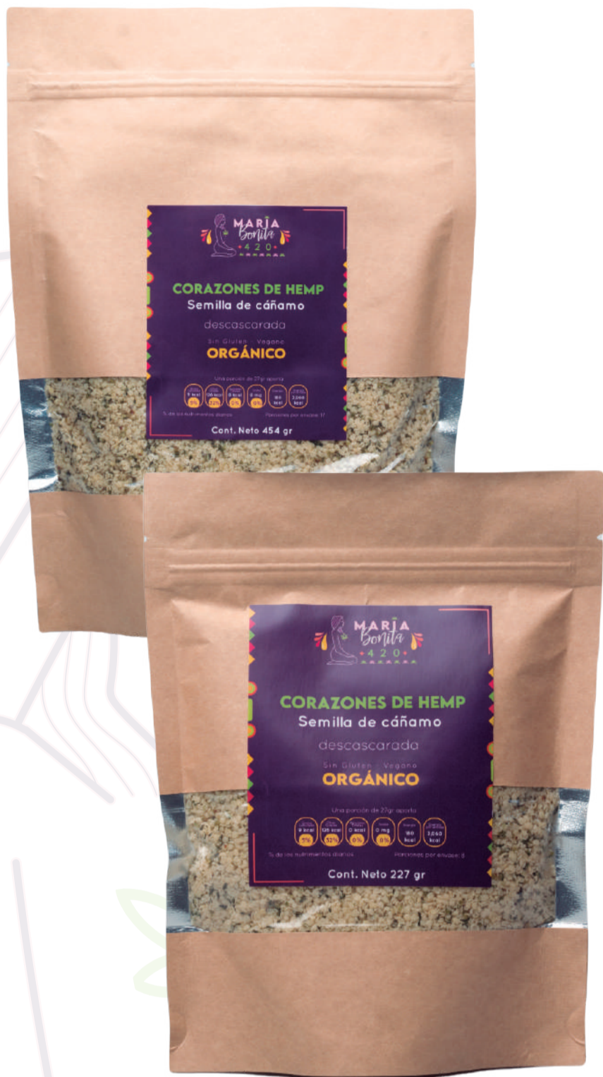
PRESENTACIÓN 227 G

Los corazones de semillas de cáñamo o hemp son excepcionalmente nutritivos y ricos en grasas buenas, proteína vegetal y minerales.